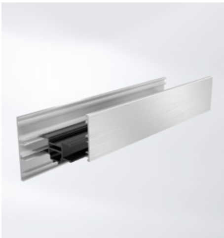
Schubloser Verbund zur Reduktion des Bimetall-Effektes Assiemaggio a scorrimento per la riduzione dell'effetto bimetallico