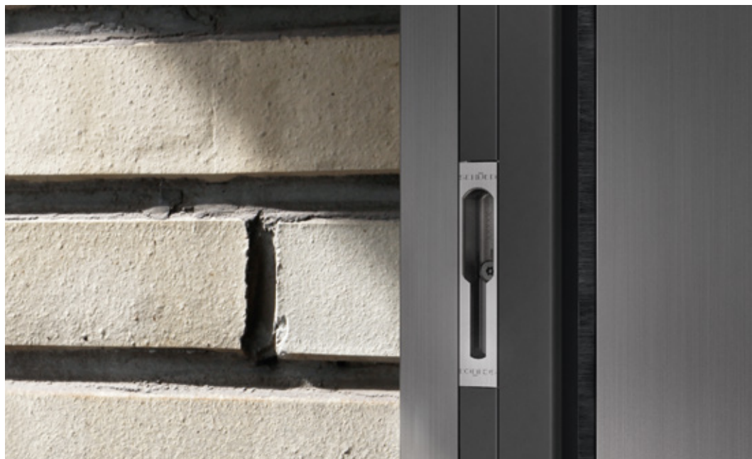
Beschlagsoption mit flächenbündiger Verriegelung im Blendrahmen Opzione di apparecchiatura con chiusura complanare nel telaio fisso

Die Schüco Schiebesystem-Plattform ASE 60/80 ist derzeit das einzige System am Markt, bei dem das Beschlagsystem sowohl als Schiebels als auch als Hebe-Schiebe-Beschlag eingesetzt werden kann – und dies in zwei Varianten.