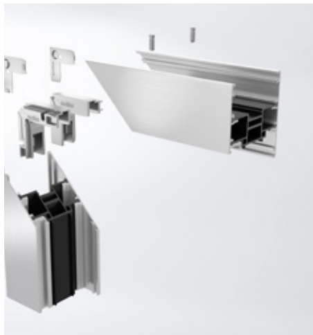
Schraubbare Eckverbinder als Option Squadrette a vite come opzione